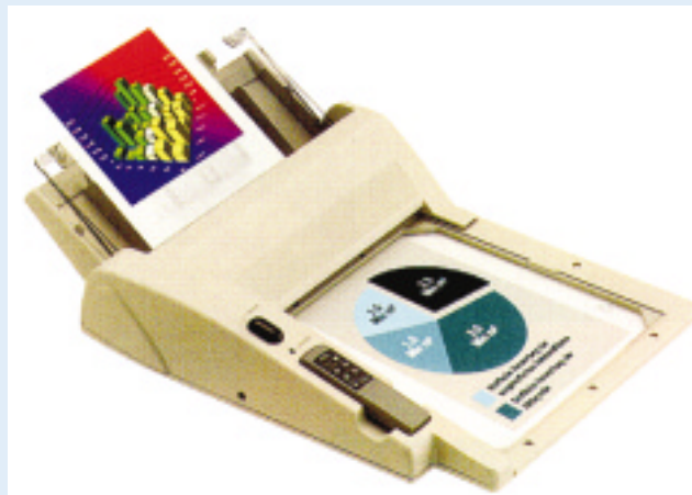
Feeder Der lästige Folienwechsel am Overhead-Projektor hat mit dem „DF-20 Feeder“ von Medium ein Ende. Per Fernbedienung kann der Nutzer bis zu 30 DIN-A4-Folien geordnet, ganz oder schrittweise auflegen ohne seinen Vortrag zu unterbrechen. So sparen Sie eine Hilfskraft ein. Der „DF-20“ kostet 498 Mark.

■ Dreidimensionale Grafiken bauen sich in Sekundenschnelle auf und bewegen sich wie von Geisterhand gelenkt über den riesigen Bildschirm des Konferenzraums. Kein Zukunftsszenario, sondern nur eine der vielen Möglichkeiten, die moderne Hilfsmittel bieten, um eine Präsentation anschaulicher zu machen. Konventionelle Geräte wie Projektoren, Großbildschirme und Videorecorder sind längst zu High-Tech-Apparaten für den multimedialen Einsatz aufgerüstet worden. Für graues Präsentations-Einerlei gibt es keine Entschuldigung mehr.