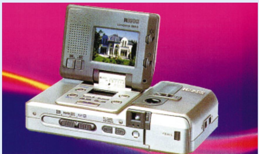
Digital Camera Digitale Fotokameras machen die Laborentwicklung überflüssig. Bilder können als Daten gespeichert und am PC etwa für Präsentationsprospekte weiter bearbeitet werden. Geräte wie die „RDC 2“ von Ricoh für 1.599 Mark senden über entsprechende Anschlüsse Fotos direkt an Großbildschirme und Projektoren. Die stark vergrößerten Bilder machen jede Präsentation lebendiger.